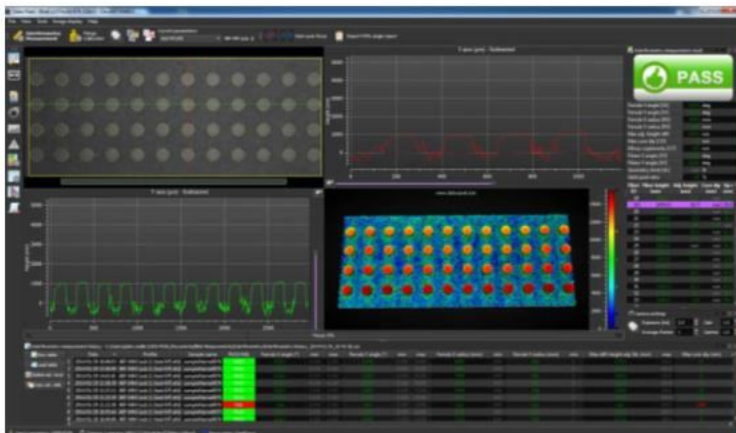
MPO-48 PC endface measurement example.