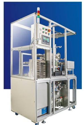
精工技研 SFPS-V1 Automated Fiber Polishing System